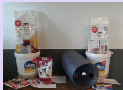
Specific suprise box